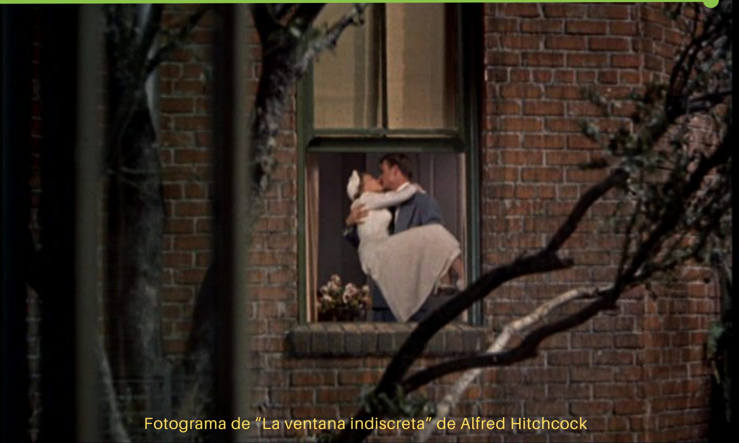
Fotograma de "La ventana indiscreta" de Alfred Hitchcock

En cada una de las fotos procuramos que haya al menos una persona, luego imaginamos y escribimos una pequeña historia inventada a partir de la imagen generada.